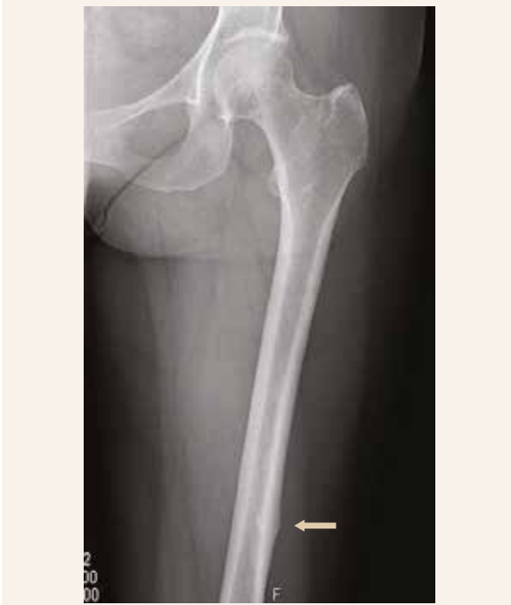
Obr. 2 | CT-scan levé stehenní kosti (11. 1. 2019, vstupní): horizontálně probíhající vlasová linie v laterální části kortikalis ve střední třetině diafýzy levého femoru